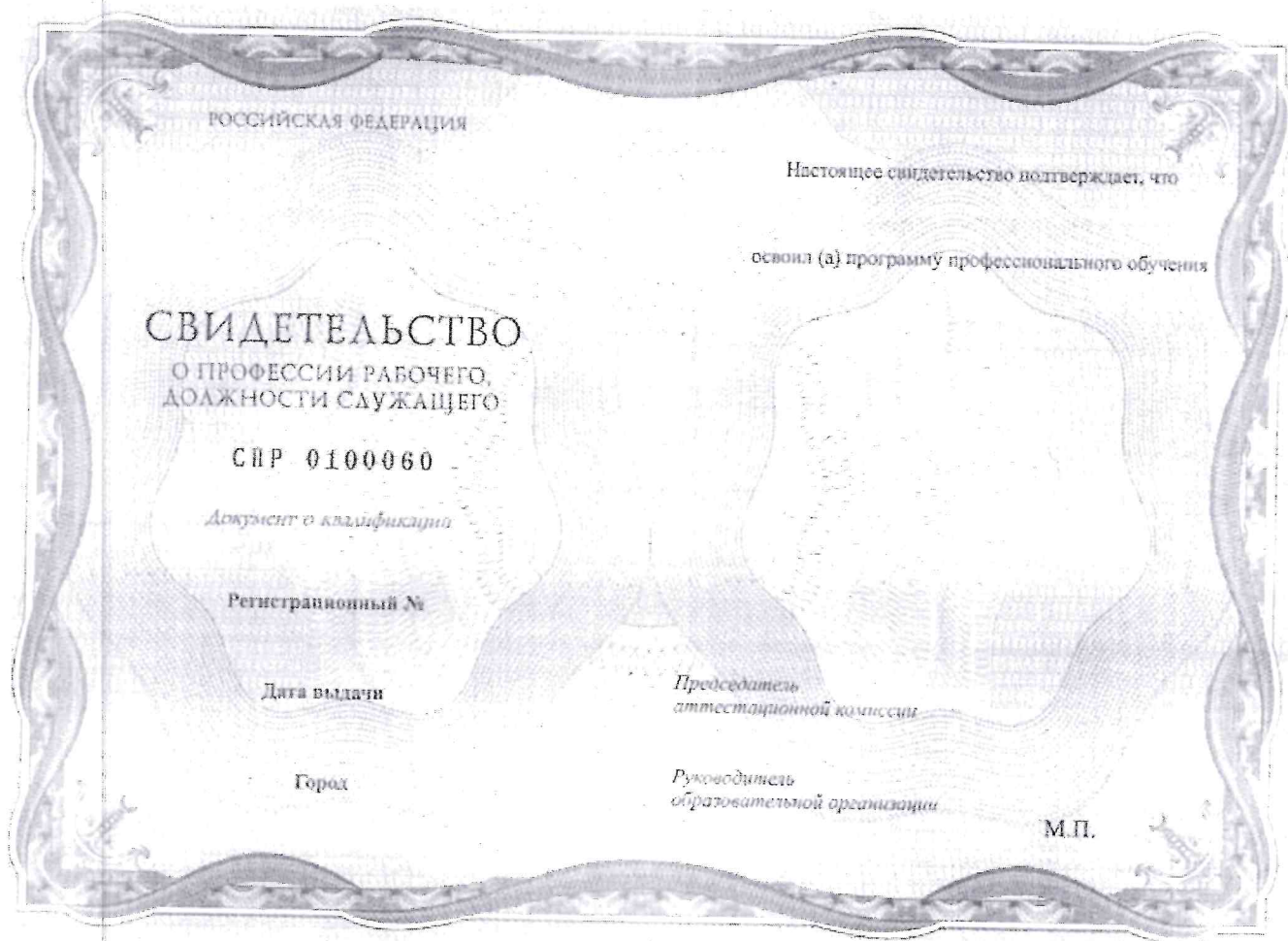
Рисунок 2. Обратная сторона бланка свидетельства о профессии рабочего, должности служащего